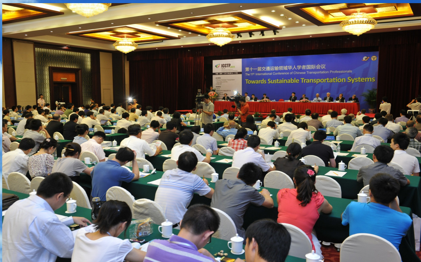
第十一届交通运输领域华人学者国际会议现场

议给与了很高的评价。此次会议的成功举办，不仅展示了中国交通运输系统的跨越发展、展现出我国该领域研究人员的实力，同时以事实证明了我国举办高水平大型国际学术会议的能力，为我国今后申办高水平的国际学术会议奠定了坚实的基础。