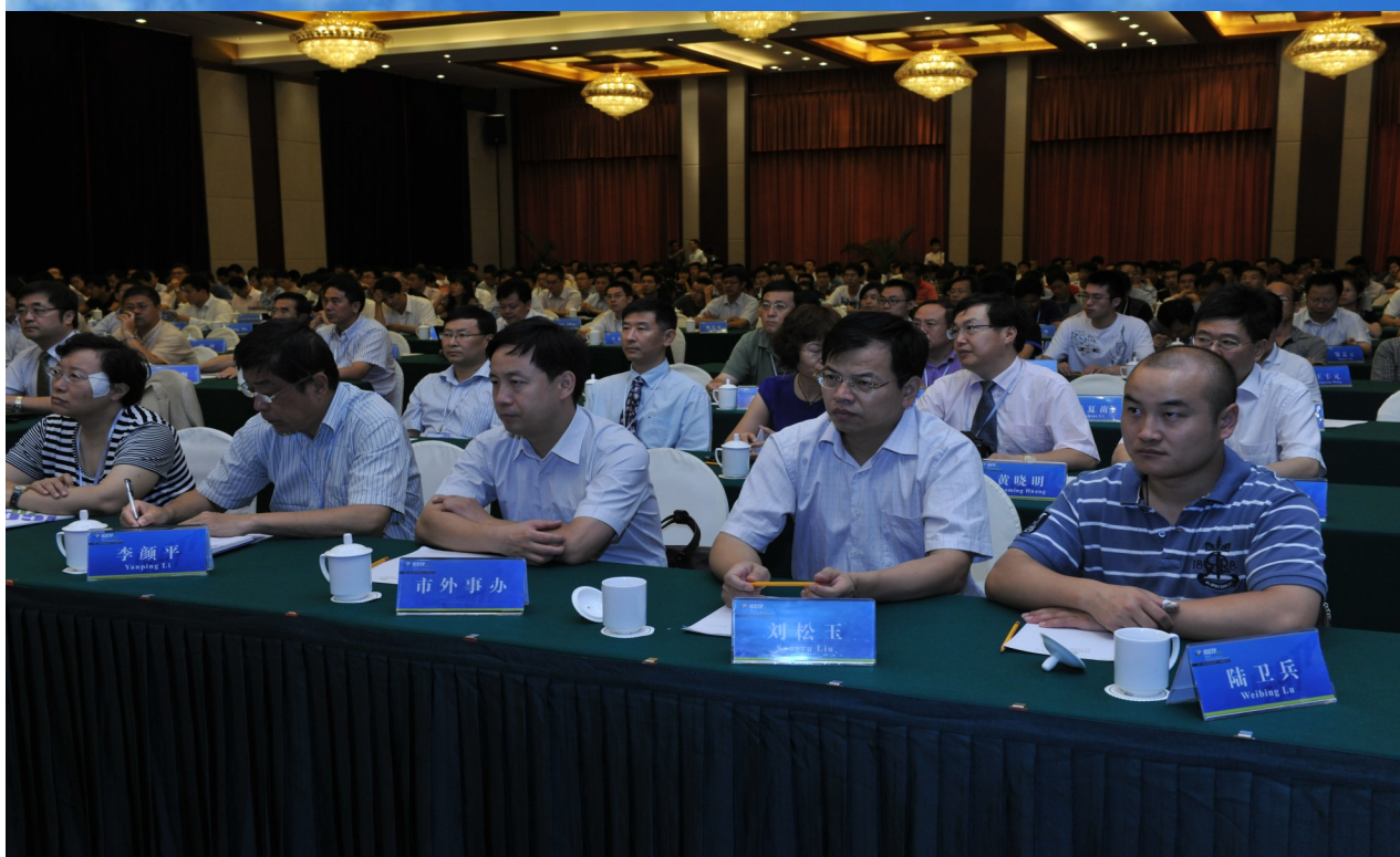
十一届交通运输领域华人学者国际会议现场