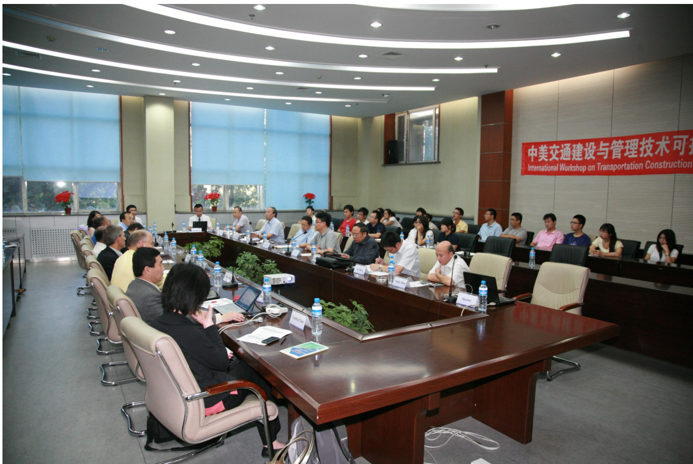
中美交通与道路建设技术可持续发展研讨会现场